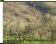
L'uliveto da esplorare