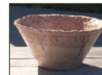
Gli antichi mestieri da riscoprire

info@agriturismocarestogubbio.it www.agriturismocarestogubbio.it