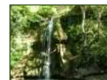
La cascata nascosta da cercare

Durante il soggiorno, oltre ad imparare antichi mestieri come quelli della cartapesta, del feltro o dei cesti in vimini è possibile fare trekking, mountain bike, passeggiate. Il riposo è rigenerante; assaporare il silenzio , i fruscii, i tramonti e i cieli notturni; vedere caprioli, lepri, volpi; ritrovare profumi dell'infanzia, del pane appena sfornato , delle marmellate di sambuco o di corniole e beneficiare di tante altre risorse della vita agreste.